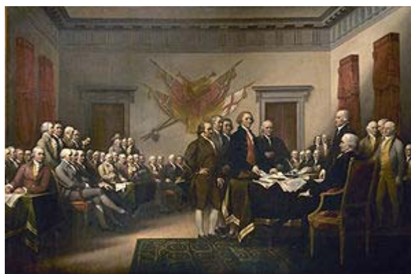
John Trumbull's Declaración de Independencia, mostrando los cinco miembros del comité encargado de redactar la Declaración en 1776, presentando su trabajo en el Segundo Congreso Continental en Filadelfia. Imagen en http://es.wikipedia.org/wiki/Revolución_estadounidense

SUMMARY: 1.- Introduction. 2.- The struggle for independence. 3.- The historic property of the American constitutional centripetal force. 4.- An analysis of the text of the Declaration of Independence. 5.- An analysis of the American Constitution. 6.- Conclusion. 7.- Bibliography.