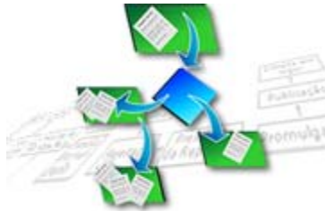
Ilustración: gráfico utilizado por la Cámara de Diputados de Brasil al explicar el “fluxo do Processo Legislativo” http://www2.camara.gov.br/processolegislativo